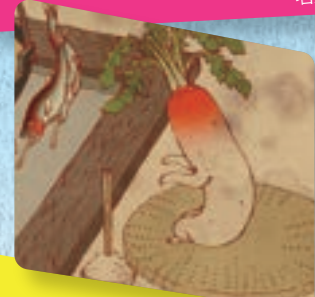
アマヤギ堂 浮世絵師